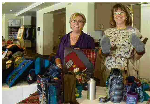
Vente au profit de la FLG

Un gros merci d'encourager nos passions. Depuis 2 ans, je fais partie de votre exposition et vous m'avez franchement donné un bon coup d'envol. Vos commentaires et vos encourage- ments me sont chauds au cœur