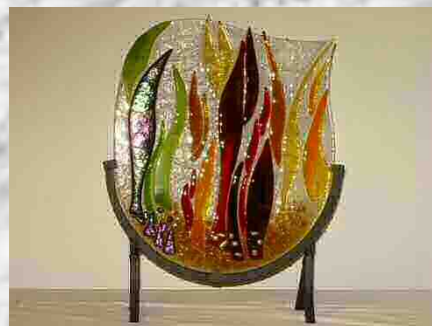
« Caresse »

Un gros merci d'encourager nos passions. Depuis 2 ans, je fais partie de votre exposition et vous m'avez franchement donné un bon coup d'envol. Vos commentaires et vos encourage- ments me sont chauds au cœur