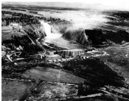
L'usine de la Dominion Textile vers 1925, avec la chute Montmorency en arrière-plan.

Dans la prochaine édition du journal, vous aurez les informations nécessaires pour la visite des lieux. Nous procéderons avec deux groupes de 25 personnes, l'un en avant-midi et l'autre en après-midi.