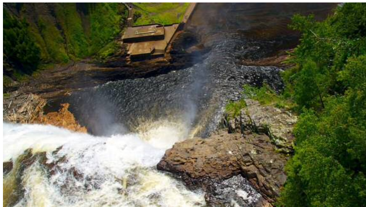
Vestiges et ruines aux Chutes Montmorency