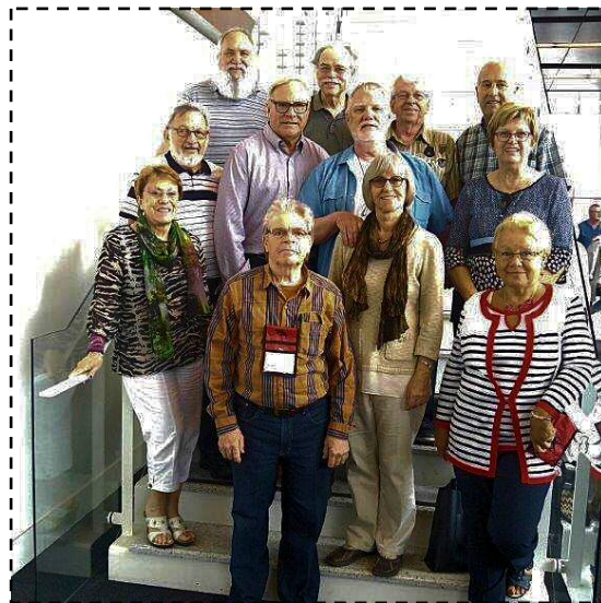
La délégation de l'AREQ Chauveau au 46 e Congrès de l'AREQ

Source : Dominic Provost Conseiller en communication – AREQ Cell. : 418 929-4082 Courriel : provost.dominic@areq.lacsq.org