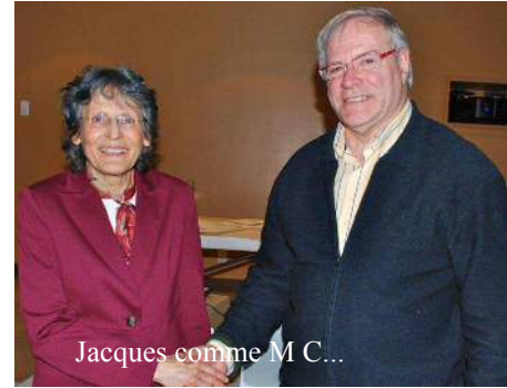
Jacques comme M C...