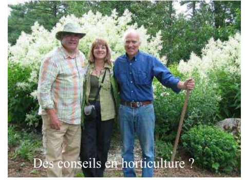
Des conseils en horticulture ?