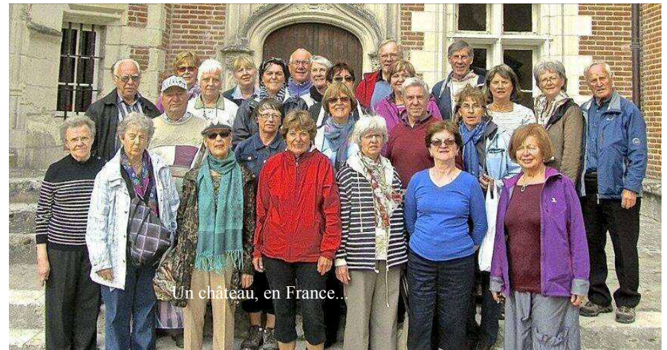
Un château, en France...