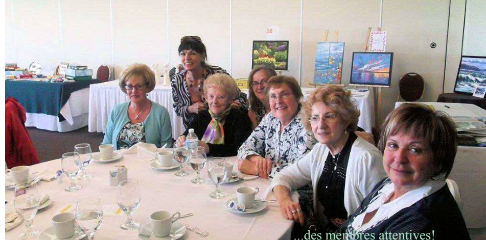
...des membres attentives!